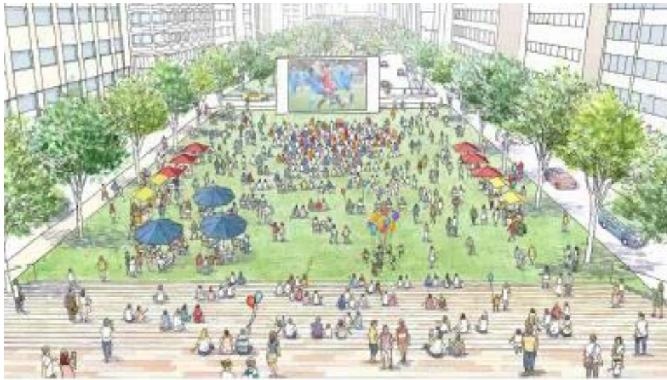
(築地川アメニティ整備構想イメージ図)