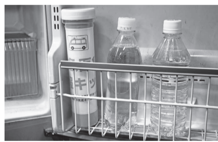
▲救急医療情報キット

自宅で倒れた時などに救急隊による救急活動がより適切に行えるよう、緊急連絡先や血液型などを記入して冷蔵庫に保管しておく、「救急医療情報キット」を配布しています。