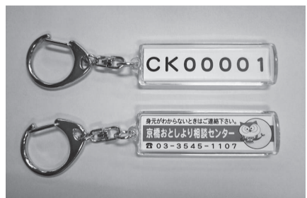
▲見守りキーホルダー

外出先で突然倒れたり、徘徊により保護され身元が確認できない場合などに、あらかじめ登録された番号をおとしより相談センターに問い合わせることで、迅速に氏名・緊急連