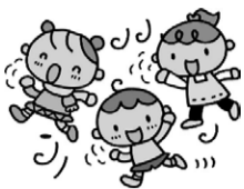
別表1 日本橋保健センター

日本橋保健センター健康係 ☎(3661)5071 月島保健センター健康係 ☎(5560)0765