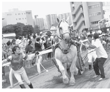
▲昨年の綱引きの様子

申し込み方法 8月2日(日)までにホームページから申込み。 その他イベントは混雑時に整理券(枚数制限あり)を配布することがあります。 天候・その他の理由により、内容を変更または中止する場合があります。 詳しくは東京シティ競馬のホームページをご覧ください。 東京シティ競馬(特別区競馬組合) HP http://www.tokyocity-keiba.com