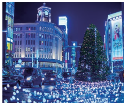
▲街はイルミネーション