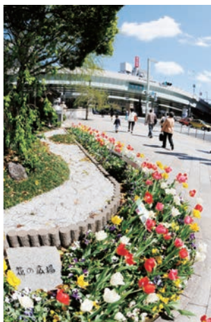
▲日本橋でチュリップ