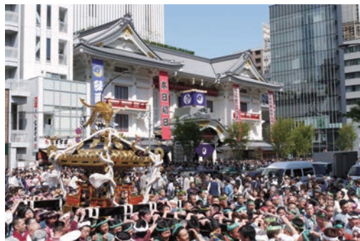
▲新歌舞伎座前を巡行