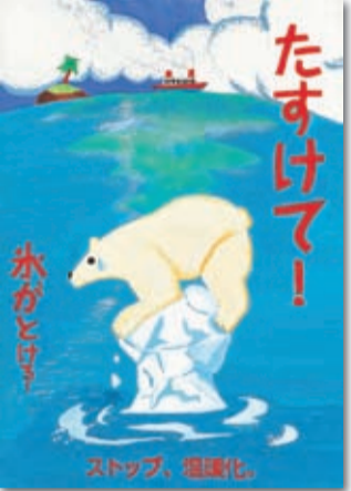
▲ポスター部門 最優秀作品 (中学生の部) 日本橋中学校2年 鴨下 映介