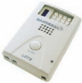
◎機械は葉書とほぼ同じサイズです。

中央、久松、築地、月島の4警察署では、振り込め詐欺の防止対策として、振り込め詐欺犯人からの電話を自動録音できる機械を、無料で設置する世帯の募集をしています。 Q 振り込め詐欺見張隊とは何ですか A ご家庭の電話に設置することで、電話をかけてきた相手に警告メッセージを流し、詐欺犯人との会話を自動録音する機械のことです。 ◎機械本体の写真は図1、機械配線図は図2参照 Q 具体的にはどのような機能がありますか A 3つの大きな特徴があります。 ・電話の呼び出し音が流れる前に「これから会話を録音します…」と警告メッセージを流します。詐欺犯人は声が残ることを嫌い、電