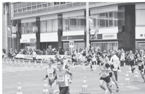
▲日本橋を走るランナー(昨年度)

コース沿道の自転車・置看板などの撤去 多くの人が安全に楽しく応援できるよう、コース沿道の自転車・バイクの駐輪、置看板などの設置はご遠慮ください。なお、放置してある物件は、区において移動・撤去する場合があります。 ※問合せ先 一般財団法人 東京マラソン財団 ☎(5500)6802 スポーツ課スポーツ事業係 ☎(3546)5531