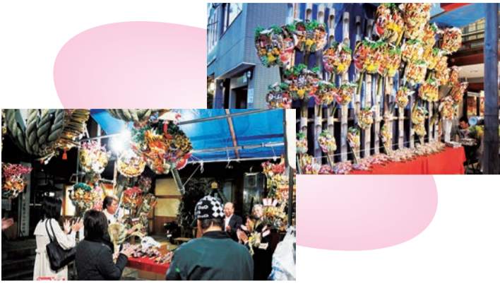
西の市(松島神社、波除稲荷神社)

11月8日、20日に人形町の松島神社(写真右上)と築地の波除稲荷神社(写真左下)で西の市が開かれました。毎年11月の西の日に開かれるこの市は、商売繁盛を祈願して、縁起物の熊手を求める参拝客で賑わいます。境内には、熊手を購入した際の手締めが響き渡っていました。