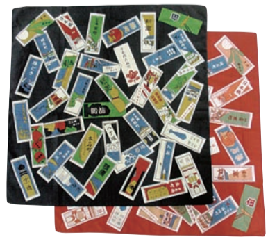
▲オリジナル千社札風呂敷

商品名 オリジナル千社札風呂敷 種類 呂敷 素材・寸法 綿100%、約五十cm×五十cm 販売定価 一枚六百三十円(税込) 外装 個別フィルム包装、帯紙に各町名デザイン の説明、包み方を記