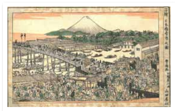
江戸当時の日本橋と魚市場

しかし、急激な人口増加に伴い、子育て、教育、高齢者福祉などさまざまな分野で行政需要が拡大しています。今後の人口動向を見極めつつ、長期的な視点から、しかるべき手を打っていかなくてはなりません。