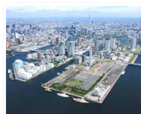
高層マンションが立ち並ぶ月島地域