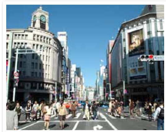
多数の企業が立地する中央区 (写真は銀座)

また、長きにわたり東京の食を支えている築地市場が大きな変革期を迎えており、これまでの築地の活気とにぎわいを維持・発展させていくことが求められています。そして、東京2020オリンピック・パラリンピック競技大会では、晴海地区に選手村が建設され、大会後には新たなまちが生まれます。