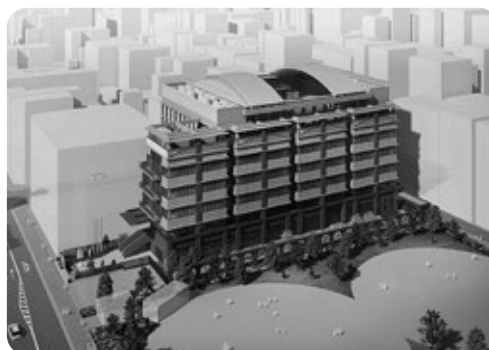
学校法人渋谷教育学園 阪本こども園