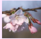
大寒桜 (オオカンザクラ)

日本にあるサクラの野生種はヤマザクラやオオシマザクラ、エドヒガンなど9種で、これを基本に自然交配や品種改良などにより、サクラの種類は350～400種類あると言われています。また、新しい品種は日本だけでなく、アメリカやヨーロッパでも生まれています。