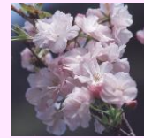
天の川 (アマノガワ)