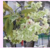
御衣黄 (ギョイコウ)