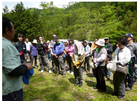
▲広場での挨拶・説明(春)