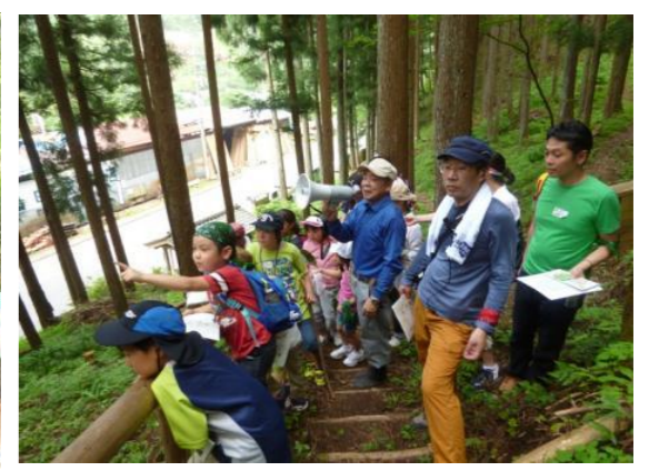
▲自然観察・間伐見学(親子)