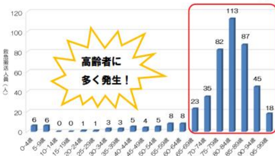
年齢層別の救急搬送人員（平成28年から令和2年まで）