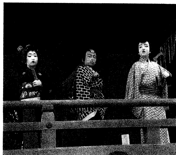
昨年写真を掲載いたしました。