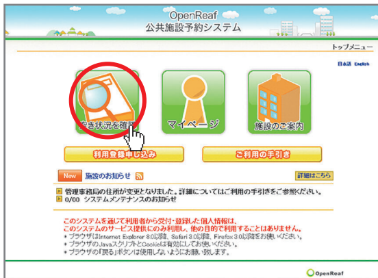
「空き状況を確認」を選択