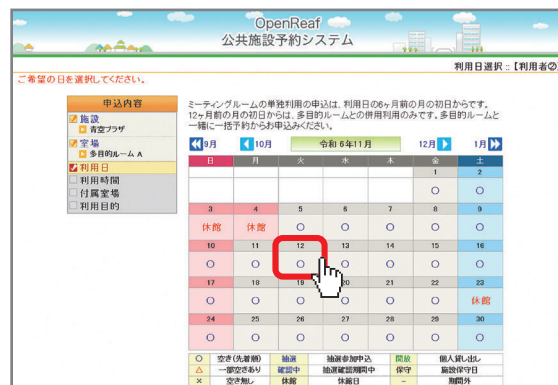
利用予定日を指定