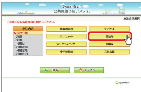
利用したい施設の分類を選択