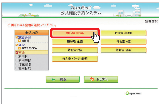
利用したい室場を選択