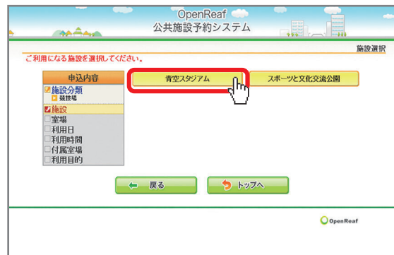
利用したい施設を選択