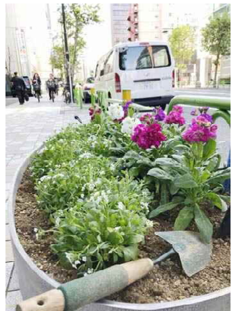
お花や緑の彩りが街に華やぎを添えますね！