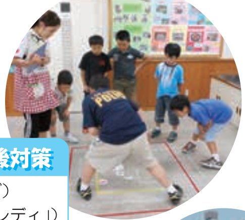
児童館活動・学童クラブ