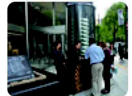
IMF東京会議おもてなしの様子

本区においては、官民一体となり戦略的・持続的に区の魅力を創造し、世界に発信する必要があります。また、グローバル化に対応した教育・学習機会の提供と環境整備が求められています。