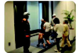
高層住宅居住者と周辺住民が連携した防災訓練

本区においては、地域の防災力向上のため活動体制の一層の強化を図るとともに、帰宅困難者対策においては東京都、民間事業者等と連携・協働体制を構築していくことが必要です。