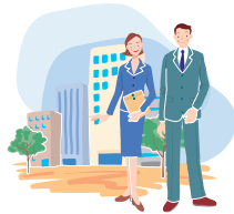
平成25年出張相談日

予約をいただいた日に、相談員が出張所へ出向いて、相談（面談）をお受けします。お気軽にご利用ください。 ◎予約申込（問合せ）先 中央区消費生活センター 電話 03-3543-0084