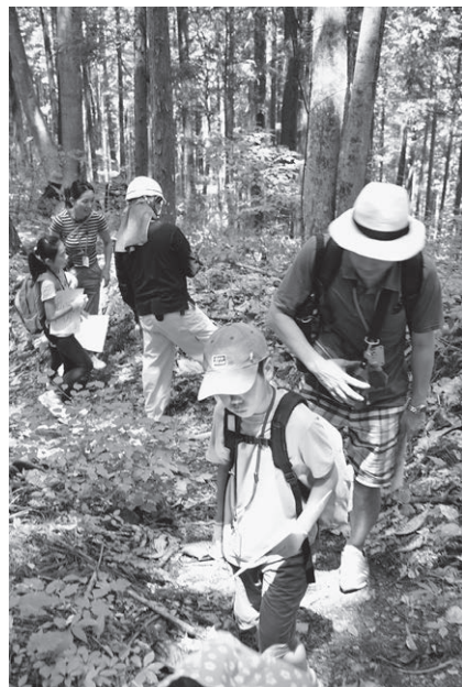
▲中央区の森親子自然体験ツアー

本区では、以前から環境問題に積極的に取り組み、省エネ、ごみ減量、リサイクルの推進、水とみどりのネットワーク形成、そして森林を荒廃から守り育てる「中央区の森」事業などさまざまな施策を展開してまいりました。