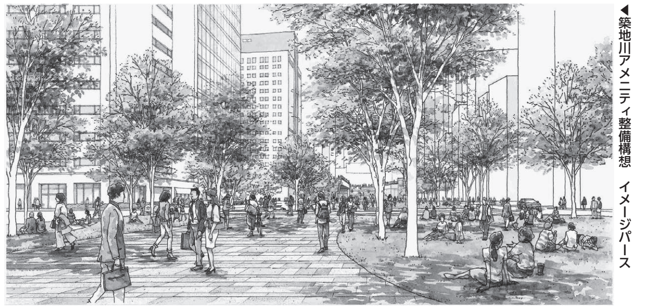
▲築地川アメニティ整備構想イメージパース

経済・商業・文化の中心として発展してきた本区は、江戸、明治、大正、昭和と各時代の名所・旧跡や建造物から絵画、伝統工芸、地域に伝わる踊りや祭りまで数多くの歴史的・文化的資産を有