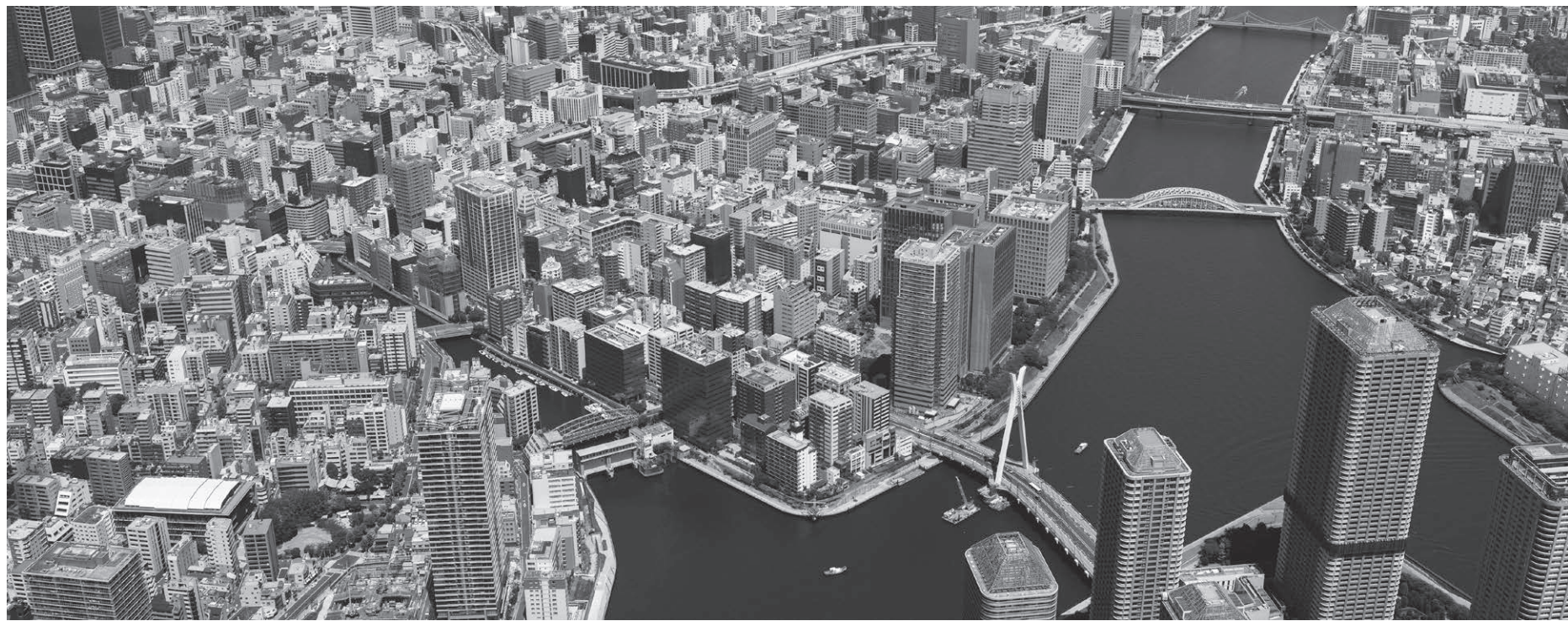
▲上空から望む中央区

重ねて区議会ならびに区民皆さま方のご理解とご協力をお願い申し上げ、所信表明といたします。