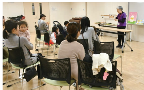
「乳幼児から楽しむ絵本の読み聞かせ」の様子

小さい頃から絵本に触れていると、大人になっても自然に本を読む習慣が身に付きます。家庭での読み聞かせは、スキップの機会も増えるし、会話の内容も広がり、感性豊かな子どもに育ってもらうためにも、とても大切だと思います。今、中央区では子どもの数が増えており、私たちが活動できる舞台もどんどん増えていくので、これからも精力的に活動を続け、子どもたちが本に親しむきっかけづくりに貢献できればと思っています。会では読み聞かせの技術を伝える活動にも積極的に取り組みたいと考えていますので、ご興味のある方はぜひ一度読み聞かせ会にいらっしゃってくださいね。そしてご自身のお子さんだけでなくもっと多くのお子さんにも読み聞かせをしたいという思いが湧いたら、ぜひ私たちと一緒に公演をしてみましょう。