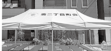
▲整備されたテント

凡例 日 日時 場 会場 対 対象 内 内容 定 定員 費 費用 申 申し込み方法 問 問い合わせ(申込)先 HP ホームページアドレス E メールアドレス