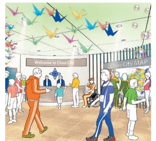
▲「晴海おもてなし拠点」(仮称) イメージ

あとはやはり、勝利至上主義じゃない、スポーツからたくさん学ぶ場所をつくってほしいです。でもそのためには、この東京2020オリンピック・パラリンピックが、メダルを取った取らないに焦点が当たるのではなく、選手たちが通ってきた道のりとか、選手たちの成長や挫折を乗り越えた経験に焦点が当たるような、そんな大会になってほしい。そして、そうしたスポーツの価値や意義を学ぶような場所をつくっていただけたら…。さらに、私たちのようなオリンピック・パラリンピアンがその場所で指導をすることができたら最高ですよ。