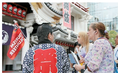
インバウンドツアーの様子

HP https://www.chuo-kanko.or.jp/volunteer