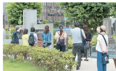
子わくわくツアーの様子