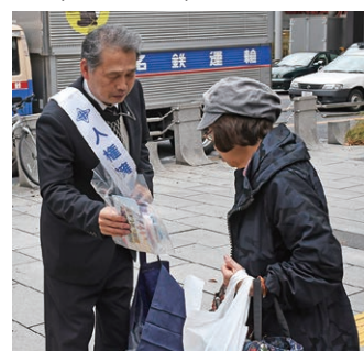
▲ 昨年の街頭啓発活動の様子