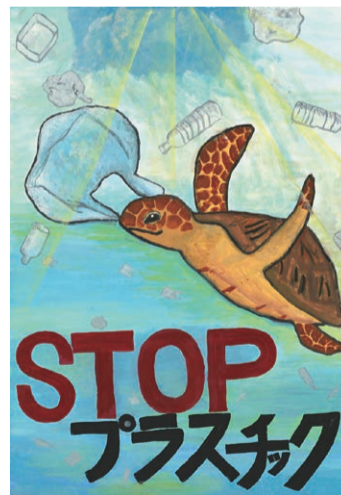
ポスター部門 最優秀作品(小学生の部) 城東小学校5年 矢澤穂音