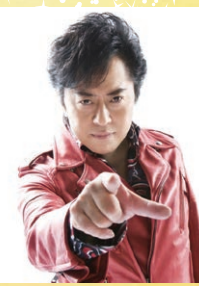
「ゲスト」 水木 一郎さん