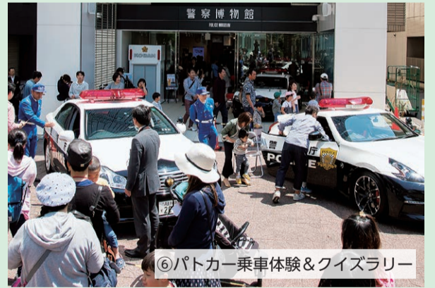
⑥パトカー乗車体験&クイズラリー