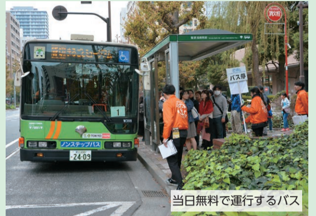
当日無料で運行するバス