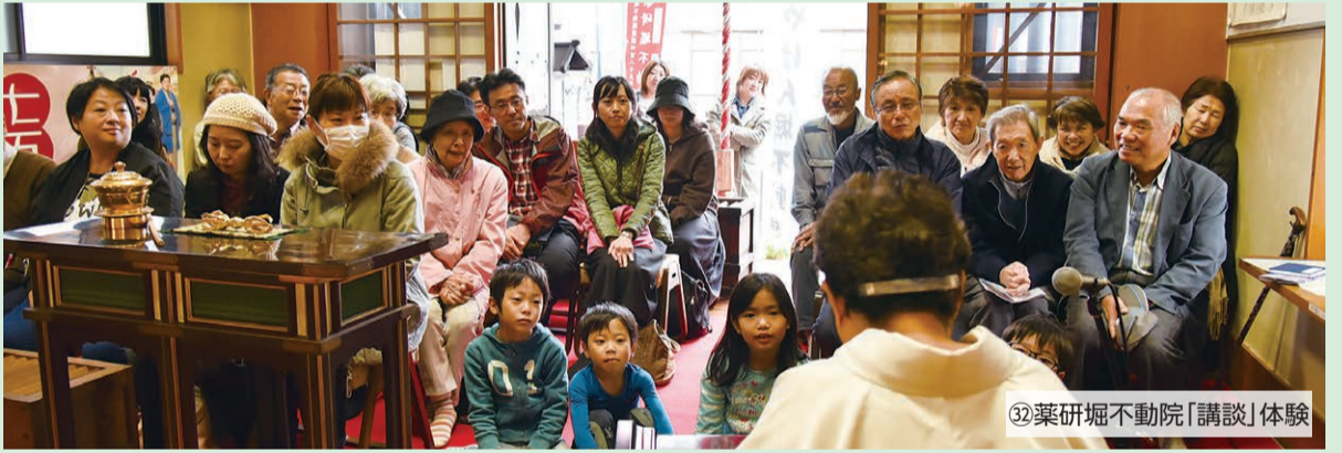
⑫薬研堀不動産「講談」体験