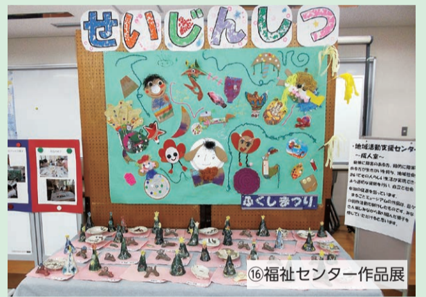
⑩福祉センター作品展