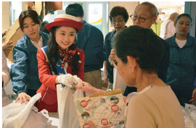
第67回中央区観光商業まつり開催中

10月1日、中央区観光商業まつりがスタートしました。11月3日まで、商店街や百貨店などが区内一円で中央区の魅力満喫できるさまざまなイベントを開催しています。東日本大震災復興支援チャリティーオープニングイベントでは、会場となった八重洲地下街に集まった皆さんに区内商店街の名産品が手渡され、多くの方でにぎわいました。