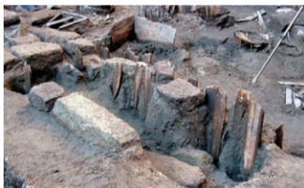
▲ 墓域に突き刺さる卒塔婆

卒塔婆は死者の供養のために立てられます。12世紀ころ出現した日本独自のもので、木製のもの