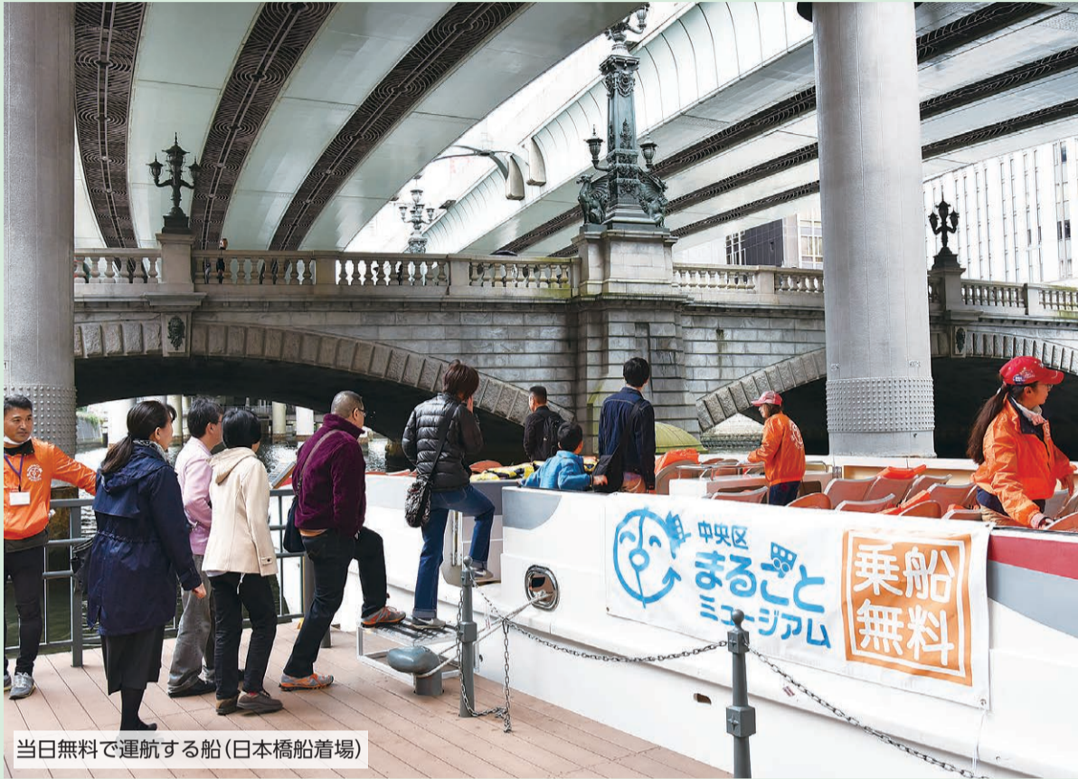
当日無料で運航する船(日本橋船着場)