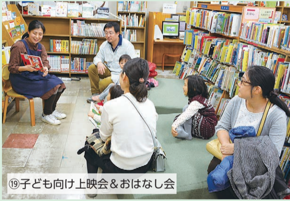
⑨子ども向け上映会&おはなし会