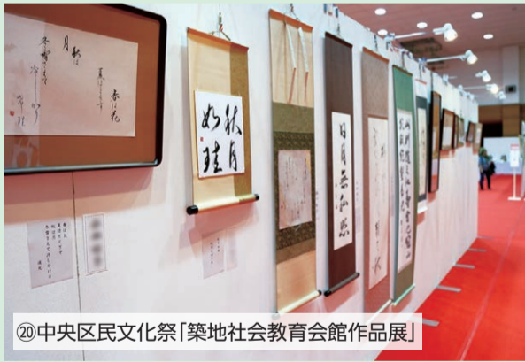
⑳中央区民文化祭「築地社会教育会館作品展」