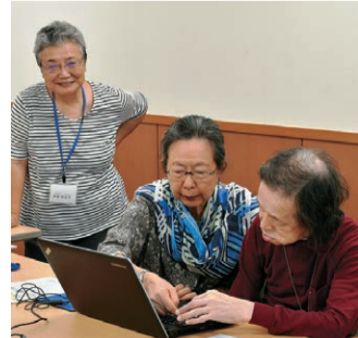
パソコン教室の様子

正直なところ現代社会は障害のある方にとって楽しいことが溢れている状況だとは思っていません。辛いことや苦しいこともたくさんあるのだらうと思います。そういった中で1回でも多く「楽しい」と思ってもらいたいですし、その感情を醸し出すお手伝いがしたいですね。心のよりどころとなるようなボランティア活動を今後も続けていこうと思います。