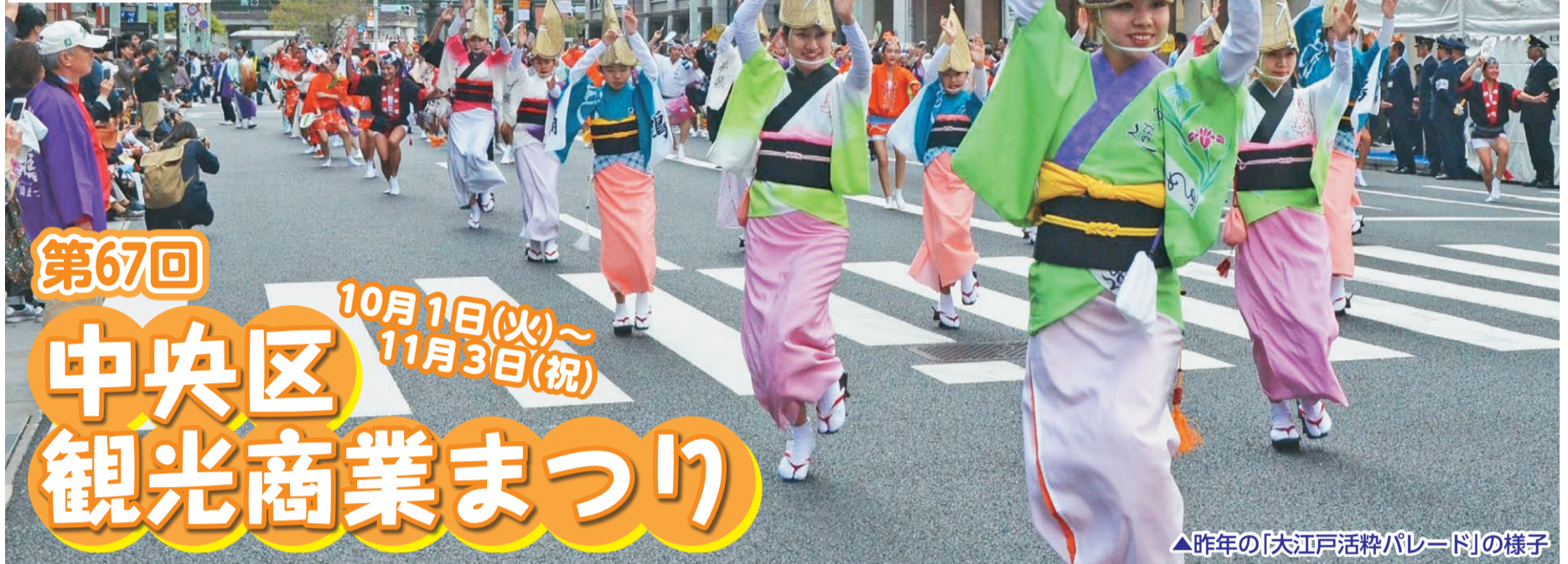
▲昨年の「大江戸活粋パレード」の様子