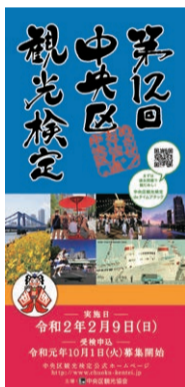
申し込み専用リーフレット