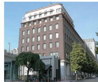
日本橋野村ビルディング旧館

1階の基壇部は、稲田花崗岩(昭和28年に長崎県五島産大春砂岩から改修)を張った仕上げで、角柱を立ち並べてコーニス(帯状の装飾)を回すなど重厚な印象を与えています。また、縦長の窓が上下に連続する中層部の2階から6階は濃褐色の平滑なタイル張りとなっており、6階の上部と下部には蛇腹状のテラコッタ装飾を施すなど、華やかな装飾を省きながら均衡と軽快なリズム感が創出されています。さらに、ややセットバックした上層部の7階は、白モルタル仕上げの壁と曲面の隅角部や格子窓が軽やかで優しい造形を生み出しており、西側にある勾配の緩い銅板葺きの屋根や相輪を思わせる頂部の鉄塔と相まって東洋風の