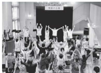
▲昨年の発表の様子