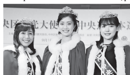
▲第37代中央区観光大使・ミス中央