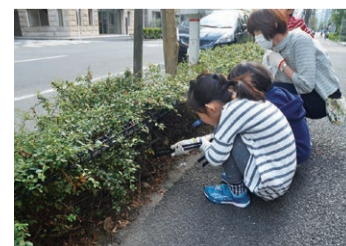
子どもと一緒に楽しく清掃中!

清掃という身近な取り組みは、まちをつなぐ輪をつくり、地域コミュニティに大きな役割を務めてきました。これからはますます輪は広がり、住む人にとっても訪れる人にとっても心とむまちであり続けることでしょう。