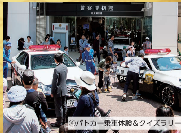
4 パトカー乗車体験&クイズラリー