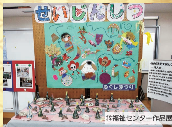
15 福祉センター作品展