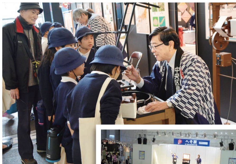
▲前回の展示の様子

障がい者スポーツ体験、ものづくり体験 ◎その他、会場を巡るクイズラリーも実施します。