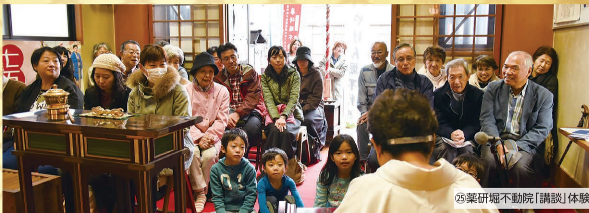
25 薬研堀不動産「講談」体験