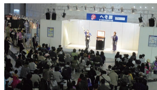
前回のステージイベントの様子▶