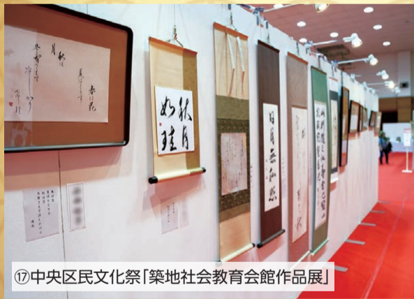
17 中央区民文化祭「築地社会教育会館作品展」