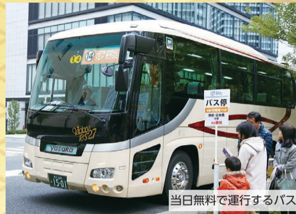
当日無料で運行するバス