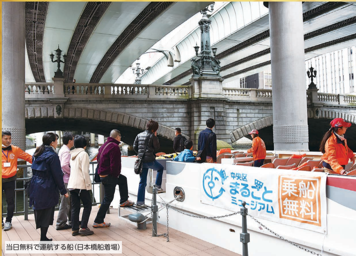
当日無料で運航する船(日本橋船着場)