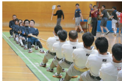
▲昨年の綱引きの様子