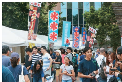
▲昨年の屋台村の様子