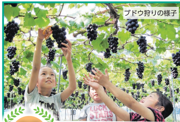
ブドウ狩りの様子