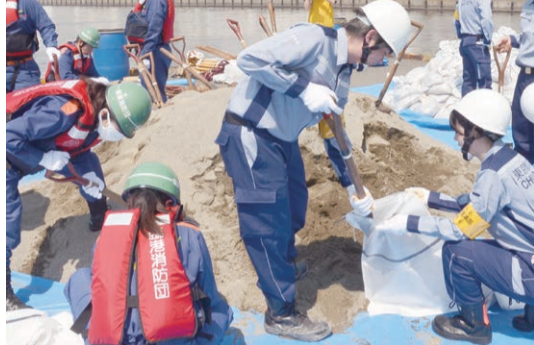
▲昨年(平成29年度)の水防訓練の様子

参加機関・団体 区内各消防署、消防団、中央区他 道路課工務係 ☎(3546)5424