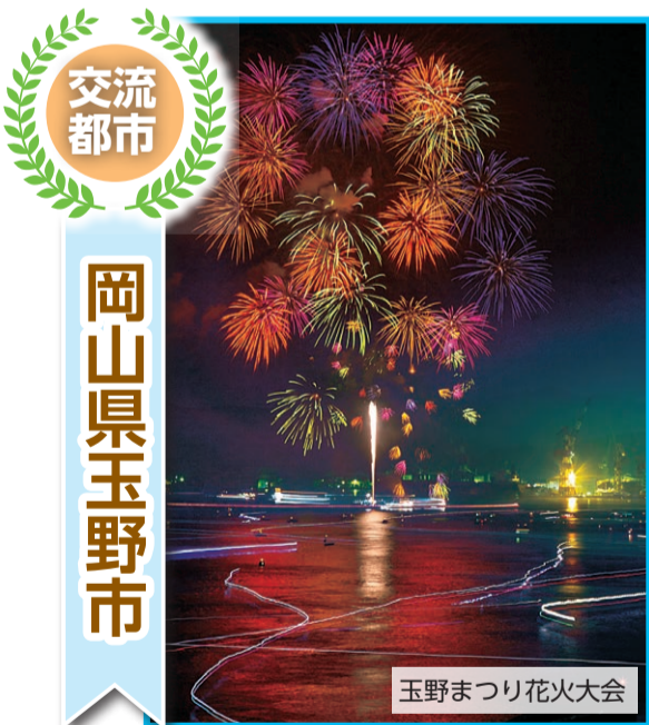
玉野まつり花火大会

玉野市は、岡山県の南端に位置し、穏やかな瀬戸内海と緑豊かな山々に囲まれた風光明媚なまちです。