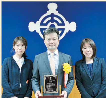
▲株式会社ニチノ緑化