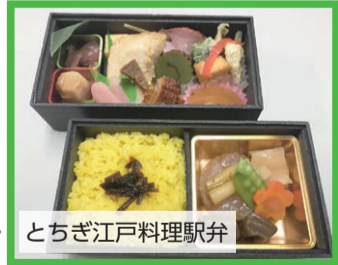
とちぎ江戸料理駅弁

栃木県栃木市は、県南部に位置し、江戸時代に舟運で栄えた街並みは、「蔵の街」、「小江戸」と呼ばれ親しまれています。今年は4月から6月まで栃木県で本キャンペーンが開催され、栃木市でもJRとコラボレーションした駅弁「大人の休日弁当～とちぎ江戸料理～」の販売や、特別料金で「蔵の街」を巡る屋形船に乗ることができるなど、さまざまな企画でお客をお出迎えいたします。