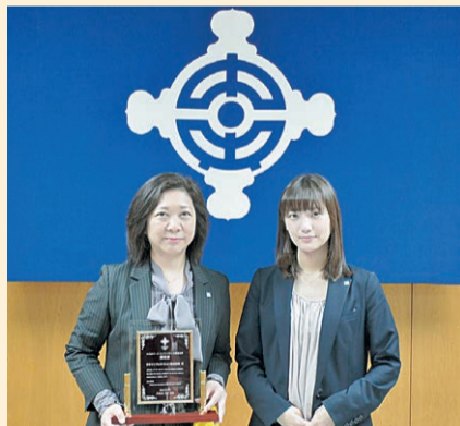
▲日本インフォメーション株式会社