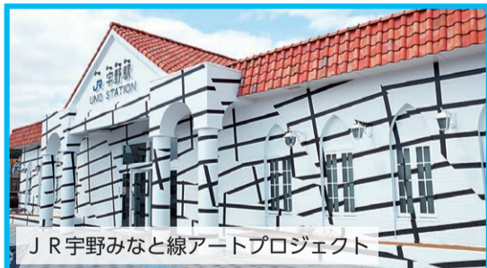
JR宇野みなと線アートプロジェクト

http://gyosan.okayama-life.jp/info/index.html