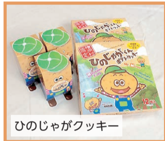
ひのじゃがクッキー

檜原村特産のジャガイモを練りこんでいます。ゆるキャラ「ひのじゃがくん」のかわいいパッケージが女性や子どもを中心に人気ですが、味も一級品。素材の良さを感じるリッチな味わいに、ほのかなジャガイモの風味が香ります。自慢の味をお楽しみください。