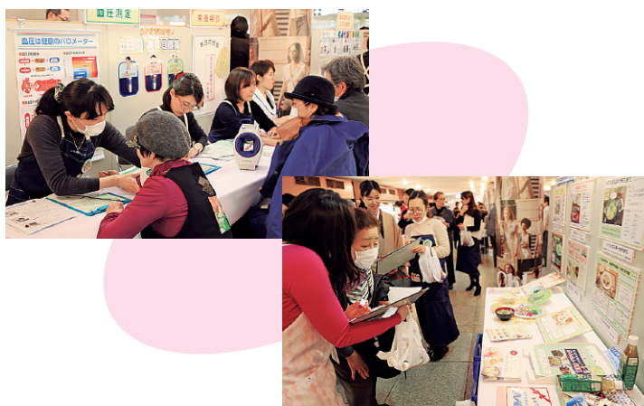
ヘルスアップ栄養2018