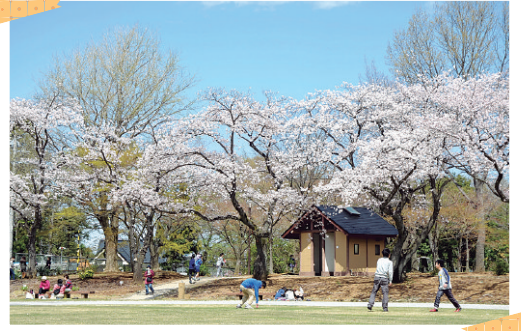
春いっぱいの柏学園