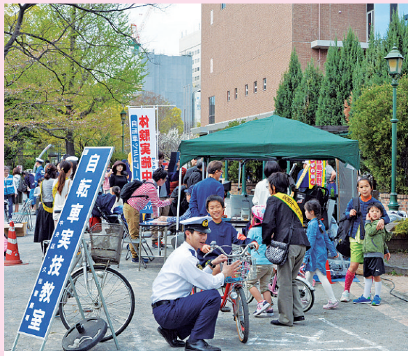
▲昨年の自転車実技教室の様子