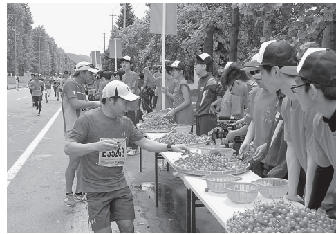
▶昨年の「さくらんぼマラソン大会」の様子

「第17回果樹王国ひがしね さくらんぼマラソン大会」参加者に中央区オリジナルTシャツを贈呈 東北随一の規模を誇るマラソン大会で、中央区民ランナーのオリジナルTシャツを着て、友好都市東根市民の皆さんとの交流を深めるとともに、爽やかな汗を流してみませんか。 対象 区内在住・在勤・在学の方からランブマラソン大会参加者50人(申し込み多数の場合抽選) 申し込み方法 さくらんぼマラソン大会への申し込みを事前に完了させた上、4月20日(必着)までに所定の申込書に必要事項を記入し、マラソン大会の参加申し込みを証明するもの(振替払込請求書兼受領証の写しなど)を必ず添付し、郵送、ファクスまたは直接持参して申し込み。 ◎在勤・在学者は社員証や学生証の写しなど、在勤・在学が確認できるものも添付してください。 ◎申込書はさくらんぼマラソン大会の案内パンフレットとともに区役所および日本橋・月島特別出張所などで配布する他、区のホームページからダウンロードすることもできます。 日 時 6月3日(日) 午前7時30分～12時30分 会場 山形県東根市 種目 ハーフマラソンの部、10kmの部、5kmの部、3kmの部、ファミリーの部 ◎申し込み期間・方法などについて詳しくは、大会ホームページおよび案内パンフレットをご確認ください。 ◎さくらんぼマラソン大会の参加費用は自己負担です。 ◎Tシャツの贈呈について 〒104-1840 中央区築地1-1-1 地域振興課地域事業係 ☎(3546)5339 FAX(3546)2097 さくらんぼマラソン大会について 果樹王国ひがしねさくらんぼマラソン大会実行委員会(東根市ブランド戦略推進課内) ☎0237(43)1158 http://www.sakuranbo-m.jp/