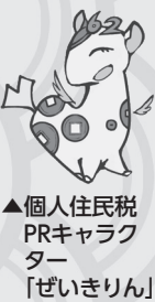
▲個人住民税PRキャラクター「ぜいきりん」