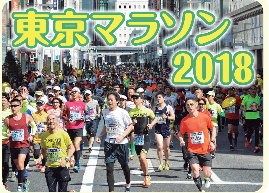
▲東京マラソン2017の様子

国内外のトップランナーや市民ランナー約3万6千人が都心の観光名所を走るアジア最大級のマラソン大会、東京マラソン2018が開催されます。区内でも中央通りなど、主要道路がコースとなり、沿道では多彩な応援イベントも行われます。 区民の皆さんには交通規制などご迷惑をお掛けしますが、ご理解、ご協力とランナーへの声援をお願いします。 日程 2月25日(日) 種目 マラソン、10km(マラソンは男子・女子、車いす男子・女子、10kmはジュニア&ユース・視覚障害者・知的障害者・移植者・車いすの各男子・女子) スタート時刻(東京都庁前) ・午前9時5分 車いす(マラソン・10km) ・午前9時10分 マラソン・10km 主催 (一財)東京マラソン財団 区内コース 区内マラソンコース図のとおり