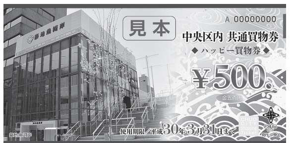
▲平成29年度のハッピー買物券(見本)