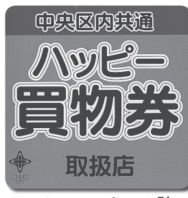
▲このステッカーの貼ってあるお店で使えます