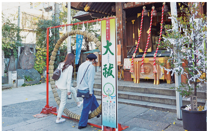
波除稲荷神社「茅の輪くぐり」

12月16日から1月10日まで、築地の波除稲荷神社で茅の輪くぐりが行われました。これはカヤ草で作られた輪をくぐることで、心身の穢れや厄災の原因となる過ちを払い清める神事です。訪れた方は、作法を確認しながら輪をくぐり、無病息災を祈りました。