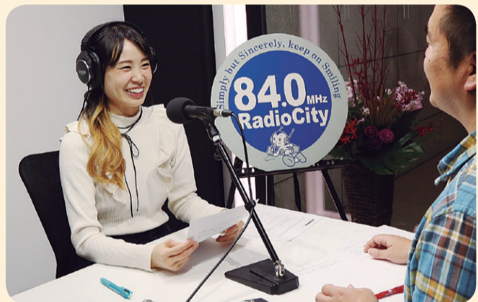
スタジオ収録風景

区民の皆さんや区内を訪れる観光客へのインタビューなどを通じて、中央区のさまざまな魅力を探ります。 ◎放送時間については6面欄外をご覧ください。YouTubeでも番組を公開しています。