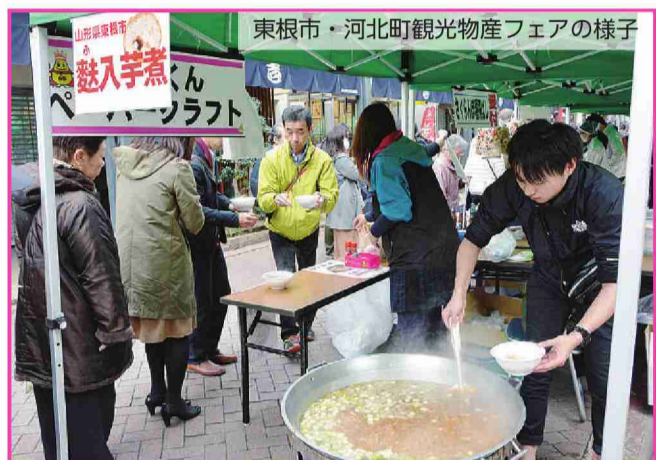
東根市・河北町観光物産フェアの様子

日程 平成30年2月(予定) 会場 黒伏高原スノーパークジヤングル・ジヤングルのジヤングルプラザ内