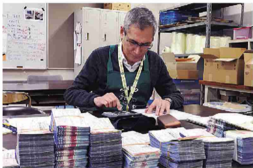
▲ハッピー買物券点検・集計業務の様子

●京橋おとしより相談センター 明石町1-6 リハポート明石等複合施設1階 ☎(3545)1107