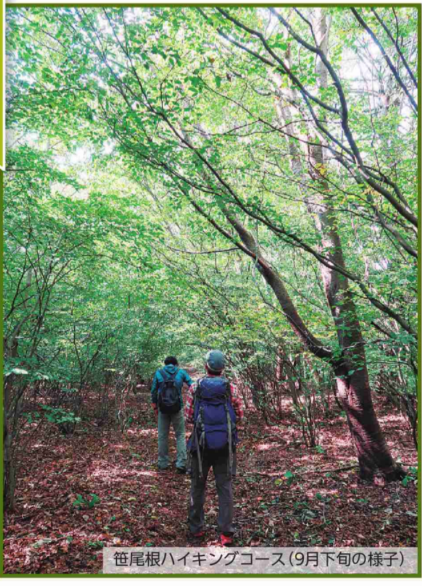
笹尾根ハイキングコース(9月下旬の様子)