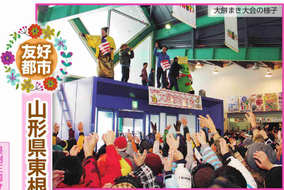
大餅まき大会の様子