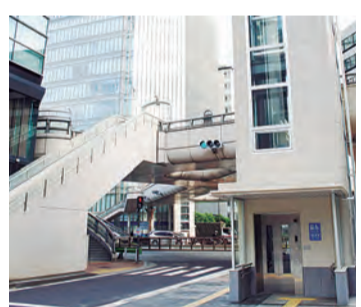
▲完成間近のエレベーター