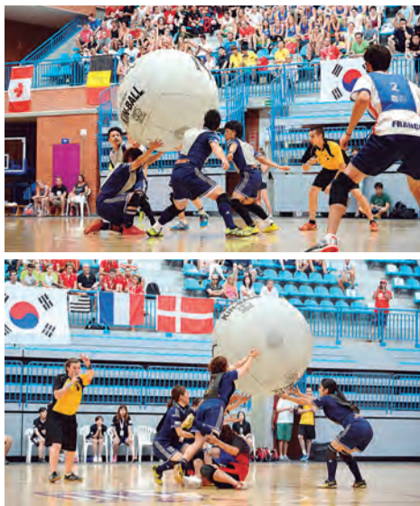
▲前回大会の日本代表チームの様子

10月5日から7日まで、日本橋人形町で人形市が開かれました。通りに並んだ57の店舗では、日本人形や西洋人形、来年の干支「戌」の置物などが販売され、訪れた皆さんは柔らかな日差しと、心地よい風を感じながら、秋の一日、思い思いに買い物を楽しんでいました。