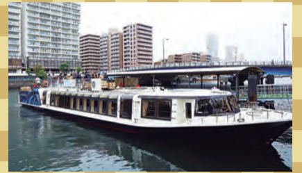
▲イベント当日、船を無料運航します