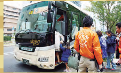
▲イベント当日、バスを無料運行します