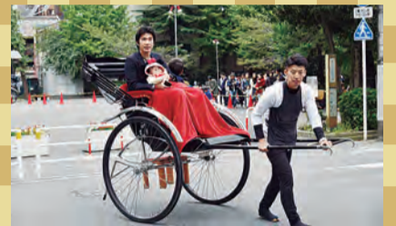
▲人力車体験ができます