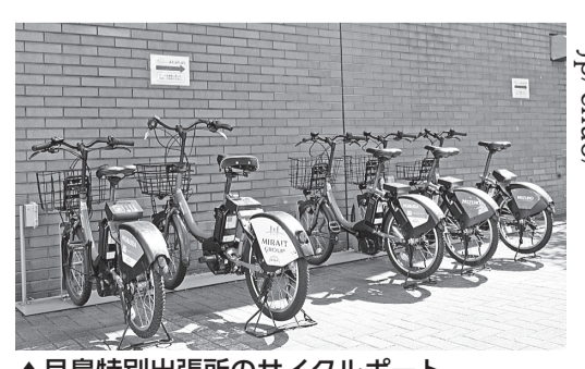
▲月島特別出張所のサイクルポート

利用登録、中央区および相互乗り入れを実施している区 利用登録、中央区および相互乗り入れを実施している区 利用登録、中央区および相互乗り入れを実施している区