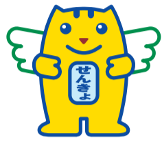
▲明るい選挙キャラクター「選挙のめいすいくん」

10月22日(日)は第48回衆議院議員選挙の投票日です。皆さんの思いを国政に生かす大切な一票です。忘れずに投票しましょう。 投票できる方 投票するためには、選挙人名簿に登録されていることが必要です。今回新たに登録される方は次の要件に当てはまる方です。 年齢要件 平成11年10月23日以前に生まれた方 住所要件 平成29年7月9日以前に転