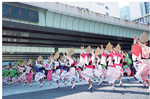
▲昨年の「大江戸活粋パレード」