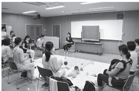
▲昨年の「ママの健康チェック」の様子