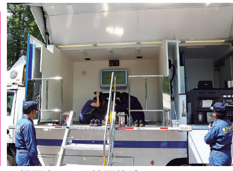
▲起震車による地震体験