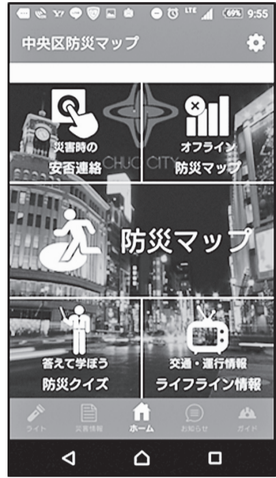
▲ポータル画面イメージ

また、災害時、安全に行動するには正確な情報が必要です。区が配信する情報を複数の手段で入手できるように、事前に確認しておきましょう。