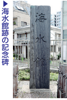
海水館跡の記念碑

隅田川河口部に位置する佃地区は、中央大橋から約150m東の佃二丁目地先で隅田川の流れを東西に分流させる(東の隅田川派川は豊洲運河・晴海運河へと流れる)地形となつています。なお、明治中期以降に月島地域の埋め立て造成が実施されるまで、当該地区は石川島(現在の佃一丁目11番、同二丁目1・3番、2番の一部)と佃島(現在の佃一丁目1〜10番)の2つの人工島で構成されてきました。江戸の昔から人々の遊覧の地であった佃島は、とりわけその美しい景観が称賛されてきました。「江戸名所図会」に記された佃島の情景には、「弥生の潮乾には貫賤袖を交へて浦風に酔を醒し貝拾ひあるいは磯菜摘なんと其興殊におおひ月平沙を照しては漁火白く芦辺の水鶏波間の千鳥も共に此地の景色に入りて四時の風光足すとす事なし」とたたえられ、芭蕉の弟子・宝井其角の俳句「名月やここ住吉のつくたしま」も添えられて