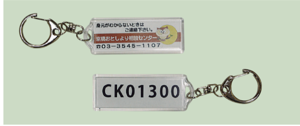
▲見守りキーホルダー