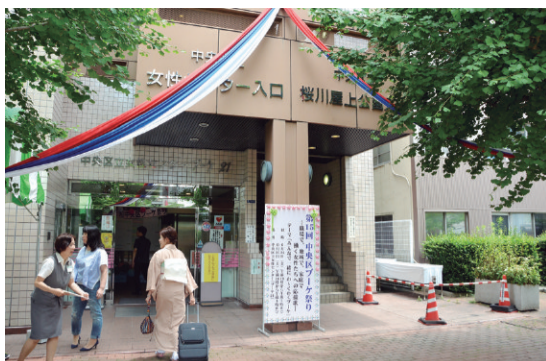
▲昨年のブーケ祭りの様子

5月21日、西多摩郡檜原村にある「中央区の森」で、森林保全活動を体験するツアーが行われました。