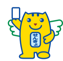
▲明るい選挙キャラクター「選挙のめいすいくん」

期日前投票 投票日当日に仕事・旅行・病気・住所移転などの理由で投票所へ行けない方は、期日前投票ができます。