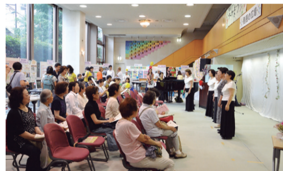
▲昨年のブーケ祭りの様子

5月8日(月)開催の中央区青少年問題協議会で決定した基本方針は、次代を担う青少年が、心身ともに健康で、社会において信頼と尊敬を得られる豊かな人間性と創造性を備えた人間に成長できるように、家庭、学校、地域、行政などが連携し健全育成を推進するための活動指針です。