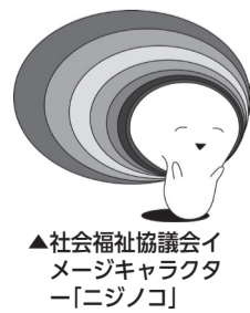
▲社会福祉協議会イメージキャラクター「ニジノコ」