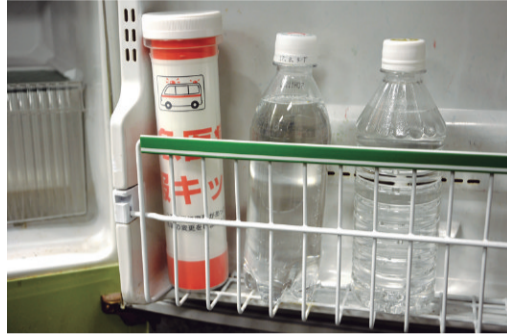
▲救急医療情報キット

「救急医療情報キット」 自宅に倒れた時などに救急隊による救急活動がより適切に行えるよう、緊急連絡先や血液型などを記入して冷蔵庫に保管しておく「救急医療情報キット」を配布しています。