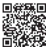
▲女性センターホームページのQRコード

女性センター「ブーケ21」 女性センター「ブーケ21」 http://bouquet21.genki365.net/