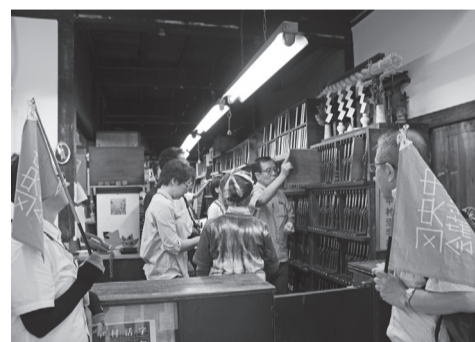
▲ツアー中(活版印刷「中村活字」内)の様子

はがき1枚につき1コース申し込みます。応募チラシは区内各施設で配布します。インターネットでの申し込み 中央区観光協会ホームページ「2017中央区「わくわくツアー」参加者募集」から必ず事項を入力して申し込む。結果通知および支払い方法 開催日の7日前までに、返信用はがきまたはメールで抽選結果を通知します。当選の方は、通知でお知らせするコ