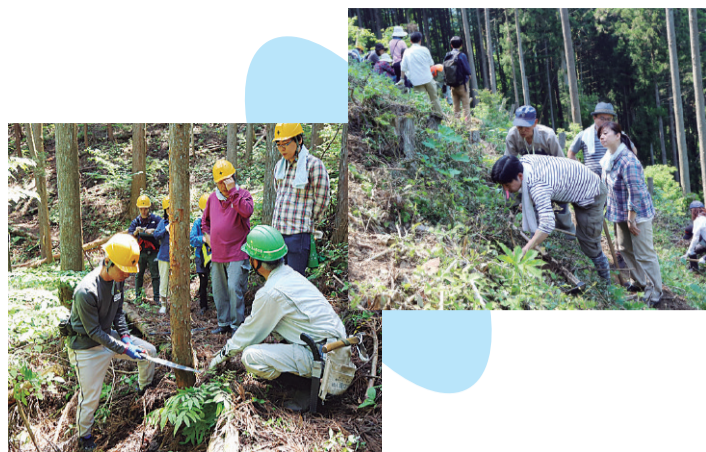
中央区の森体験ツアー

5月21日、西多摩郡檜原村にある「中央区の森」で、森林保全活動を体験するツアーが行われました。