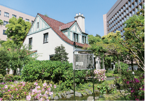
▲春のトイ斯拉ー記念館

(1) 「区のおしらせ 中央」は毎月1日、11日、21日の月3回発行。次回6月1日号は町会・自治会配布です。