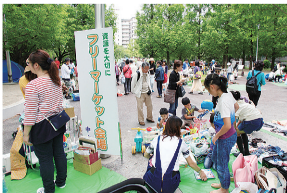
フリーマーケットの様子