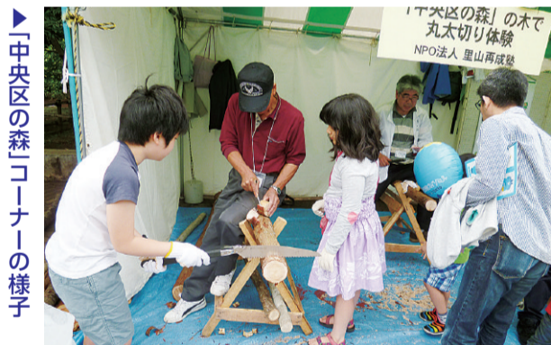
中央区の森コーナーの様子