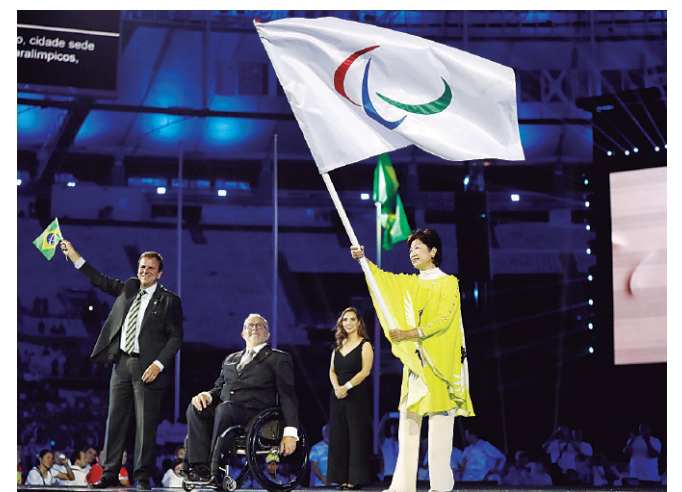
▲リオ 2016 パラリンピックフラッグハンドオーバーセレモニー