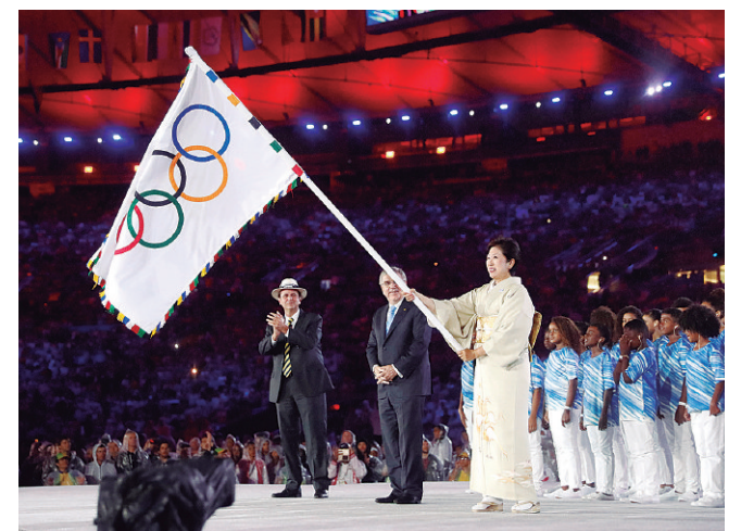
▲リオ 2016 オリンピックフラッグハンドオーバーセレモニー