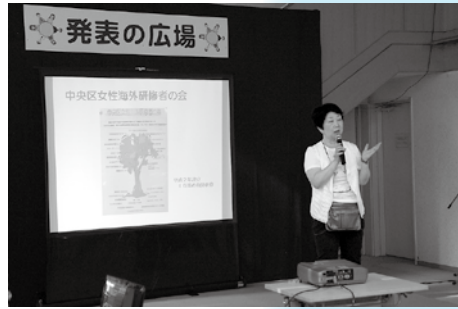
活動内容や家庭料理講習会などを紹介しました。 (中央区女性海外研修者の会)