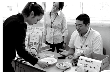
自助具の体験などを行いました。 (中央区社会福祉協議会)