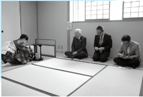
お茶会を行いました。矢田区長も一席参加しました。 (茶友倶楽部えん)