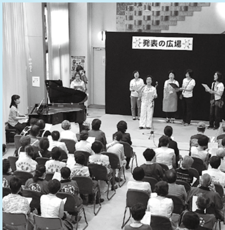
閉会式のフィナーレ。皆で「花は咲く」を合唱