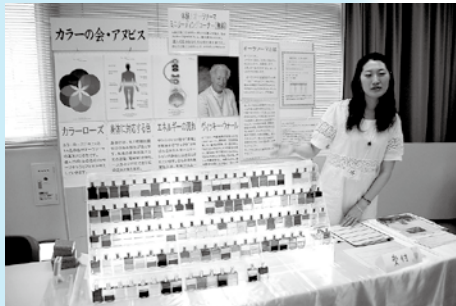
オーラソーマに関する展示や無料体験を行いました。 (カラーの会・アヌビス)