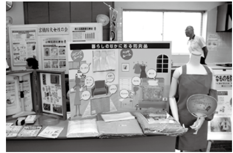
防火防災の展示と AED の展示指導をしました。 (京橋防火女性の会)