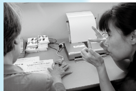
健康についての展示と血管年齢を測定しました。 (中央区保健係)