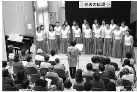
美しいコーラスを披露しました。 (新婦人コーラスエーデルワイスの会)