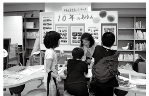
10年間の活動内容を展示しました。 (中央区女性ネットワーク)