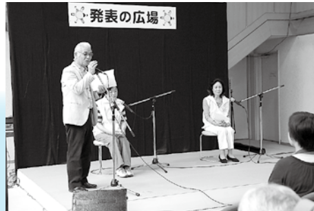
ロールプレイで傾聴ボランティアを紹介しました。 (傾聴ボランティアグループうさぎの会)