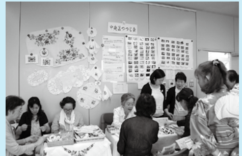
ビーズ製品や絵はがきなどを販売しました。 (中央区つづじ会)