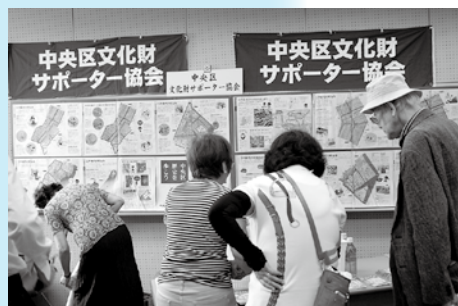
まち歩きで見る中央区の文化財を紹介しました。 (中央区文化財サポーター協会)