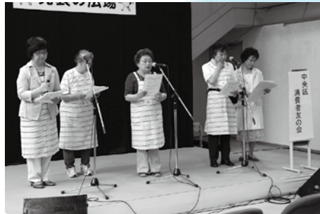
活動内容と親子消費者講座を案内しました。 (中央区消費者友の会)