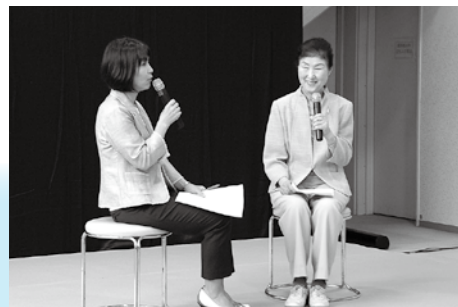
対談形式でこれまでの活動を紹介しました。 (中央区婦人学級連絡会)