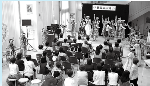
フラダンスを披露しました。(レイ・ロケラニ)