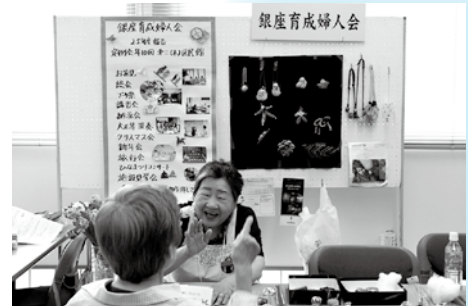
1年間の活動内容を報告しました。(銀座育成婦人会)