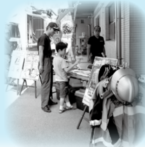
桜橋第二ポンプ場見学会の様子