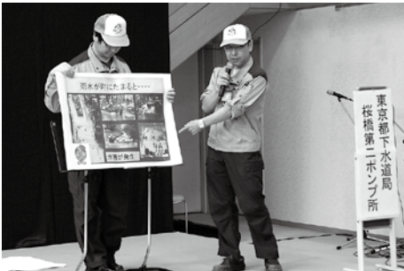
桜橋第二ポンプ所の施設の概要や都市下水道の仕組み を説明しました。(東京都下水道局桜橋第二ポンプ所)