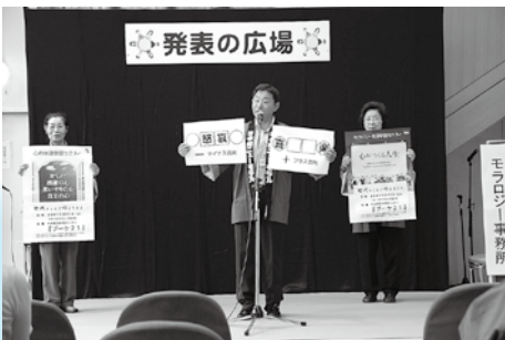
ニューモラル誌の説明と心の生涯学習を案内しました。 (日本モラルロジー事務所)