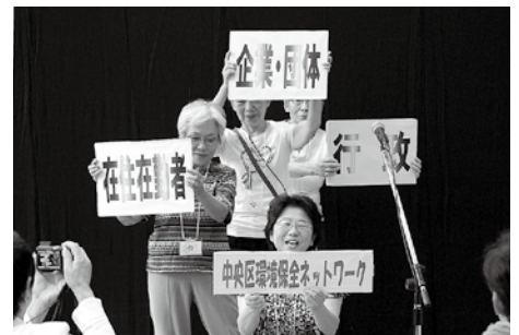
活動報告と「子どもとためす環境まつり」を案内し ました。(中央区環境保全ネットワーク)