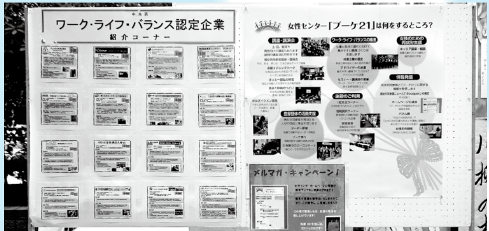
「ブーケ21」の事業内容とワーク・ライフ・バランス認定企業を紹介しました。(中央区女性センター)