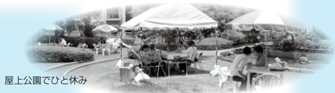
屋上公園でひと休み