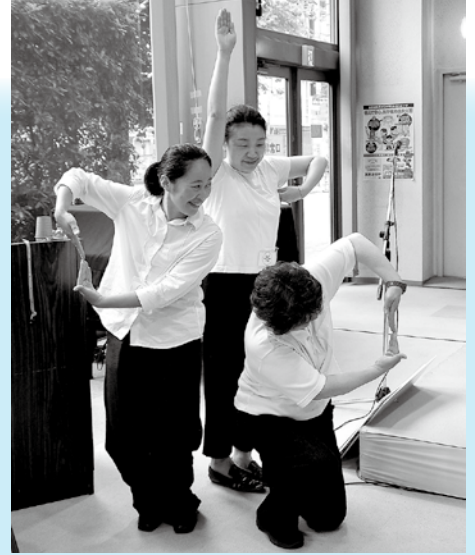
建築体操で建物になりきって構造を考えました。 (東京建築士会女性委員会)