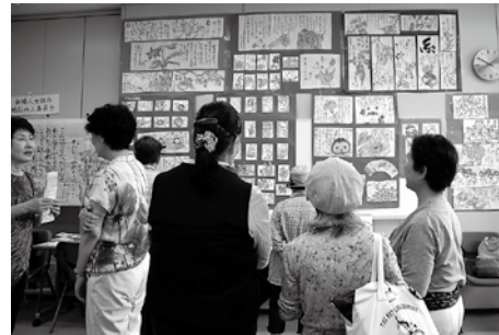
絵手紙の展示と絵手紙体験を行いました。 (新婦人女性の地位向上委員会)