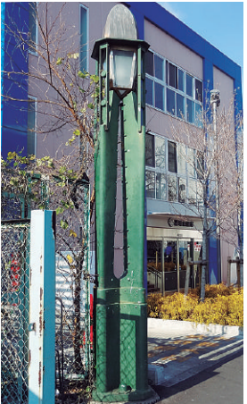
海幸橋の親柱(鋼鉄製)

支川に架けられていた海幸橋の親柱と竣工図面(14葉)です。築地六丁目の波除稲荷神社前から築地場内市場へ入るゲート橋であった海幸橋は、関東大震災後の復興事業で創架された近代橋梁の一つでした。震災で被災した日本橋魚市場の築地移転(昭和10年開場)に先立ち、東京市道路局の技師らが、大正14年(1925)に設計を行い、昭和2年(1927)に株式会社横河橋梁製作所(現在の株式会社横河ブリッジ)の施工で完成しています。なお、築地場内市場の入口に位置するこの橋は、海産物にちなんで「海幸」を冠した名称が付けられました。太い桁を主構造とする鋼桁橋の海幸橋は、細く滑らかな曲線のアーチ(補強部材)が特徴的な下路ランガー橋橋長27.5m・幅員15mでしたが、平成14年(2002)に4基の親柱を現地に残して本体は撤去(橋梁のヒンジ部と部材の一部は日本大学理工学部船橋キャンパス内に保存)されました。現地保存の親柱は、材質(鋼鉄製2基・御影石製2基)やデザイン(鋼鉄製はアムステルダム派のデザイン・御影石製の角柱は面取りした面を正面にして配置)が異なるだけではなく、向かって左に鋼鉄製親柱、右に石造親柱を配置し、これらを対称的に配置する工夫も見られます。特に、鉄材を効果的に用いた鋼鉄製の親柱は、有機的な曲線で構成される国内でも珍しいデザインの親柱となっています。