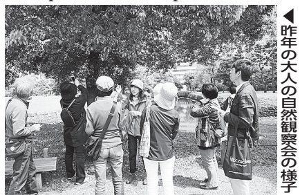
◀ 昨年の大人の自然観察会の様子

ホームページをご覧ください。電話でお問い合わせください。 固環境情報センター ☎(6225)2433 HP http://eic-chuo.jp/