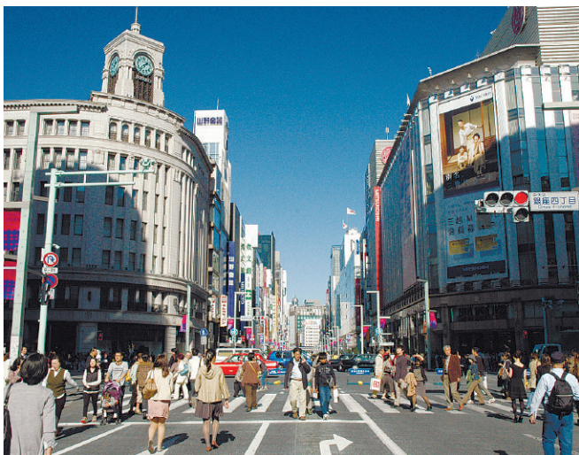
▲銀座の歩行者天国