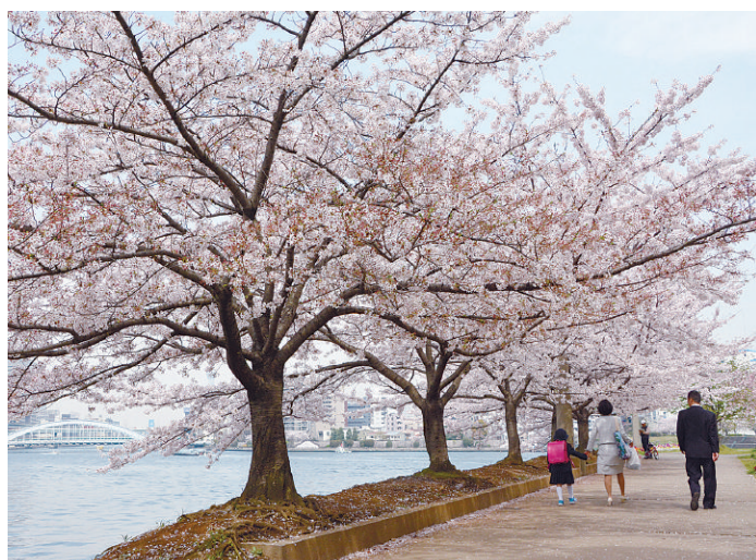
▲桜満開の石川島公園

第1章では、基本構想策定にあたっての背景と目的を明らかにするとともに、役割と理念が示されています。この基本構想を貫く理念は、「平和」を基本に、区民一人一人の生活と権利を尊重し、幸福な区民生活を確立することとしています。 第2章では、中央区の20年後の将来像が示されています。将来像は、「輝く未来へ橋をかける―人が集まる粋なまち」とし、その趣旨は、江戸以来の歴史に裏打ちされた伝統文化を育みながら輝く未来を創造し、住み・働き・集うすべての人々が、幸せを