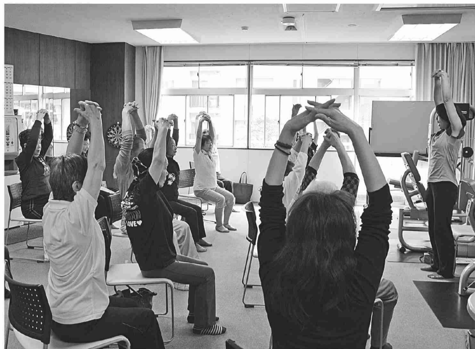
▲運動機能の維持・向上のための体操教室(桜川敬老館)

が住めるようにしよう」を合言葉に、区の総力を挙げて住環境の整備を中心とした総合的な施策に取り組み、誰もが住み良いまちづくりに向けてまい進してきた成果であります。