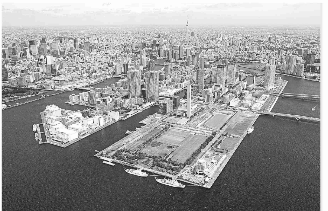
▲上空から望む中央区

また、長年の悲願である名橋「日本橋」上空の首都高速道路の移設や地下鉄新線の具体化などの中長期的な課題に対