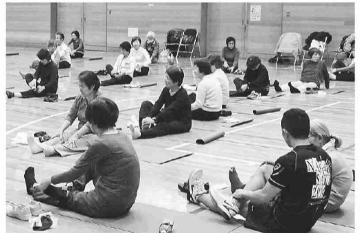
▲▼昨年の「ゆいゆい講座」の様子