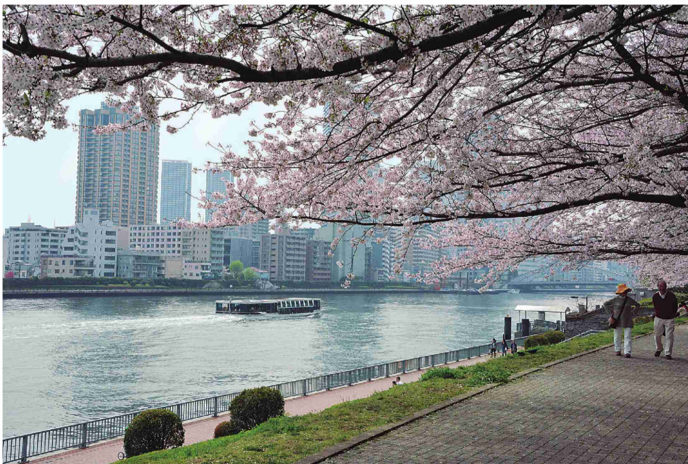
▲桜満開の明石町河岸公園