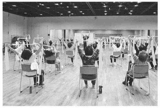
▲▼昨年の「ゆいゆい講座」の様子

運動機能や栄養状態の改善、認知機能の向上などに役立つ1回完結型の講座を行います。ご希望の講座にお申し込みください。 また、ゆうゆう講座では、既存の区内サークルや講座・イベントの紹介も行います。ご自身の健康増進や生きがいづくりのため、お気軽にご参加ください。