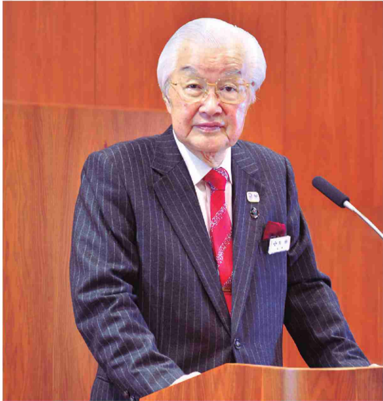
中央区長 矢田 美英

http://www.city.chuo.lg.jp ツイッター https://twitter.com/chuo_city フェイスブック https://www.facebook.com/tokyochuo.city