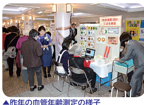
▲昨年の血管年齢測定の様子