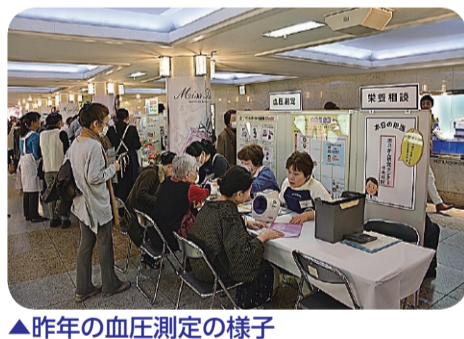
▲昨年の血圧測定の様子

について整備や活用、維持管理などの基本的な考え方・方針を示した「中央区公共施設等総合管理方針」の素案を取りまとめました。 このたび、取りまとめた素案をお知らせするとともに、区民の皆さんからのご意見を募集します。 募集期間 2月13日(月)～3月6日(月) 閲覧場所 区役所1階まごころステーション・情報公開コーナー、2階企画財政課、日本橋・月島特別出張所その他、区のホームページでもご覧になれます。 意見の提出方法 住所・氏名(団体の場合は団体名と代表者名)、年齢、電話番号を明記して、区役所2階企画財政課に直接持参、☎へ郵送、ファクス、Eメールまたは区のホームページのパブリックコメント(区民意見提出手続き)でお寄せください。 ☎104-18404 中央区築地1-1-1 企画財政課企画主査 ☎(3546)5213 FAX(3546)2095 @koukyoushitsu@city.chuo.lg.jp