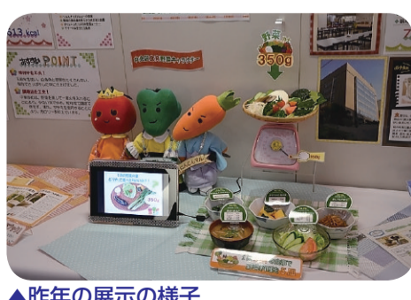
▲昨年の展示の様子

日頃、自分の健康状態が気になる方、健康チェックをご希望の方は、ぜひお立ち寄りください。 日時 3月3日(金) 午後0時30分～5時 (午後4時45分受け付け終了) 会場 地下鉄銀座駅連絡通路(松屋(前)) 内容 測定 骨密度(素足で測定)、血管年齢、血圧 展示 女性の健康づくりと生活習慣病予防、社員食堂の「野菜たっぷりメニュー」、野菜ク